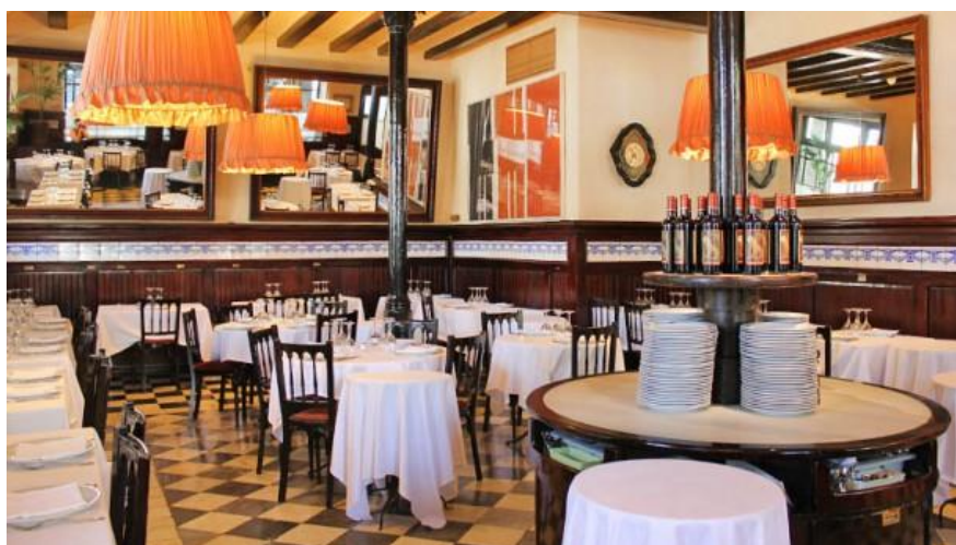
Figura 3. Sala do restaurante Sete Portes