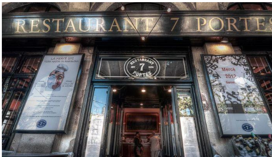
Figura 2. Restaurante Sete Portes