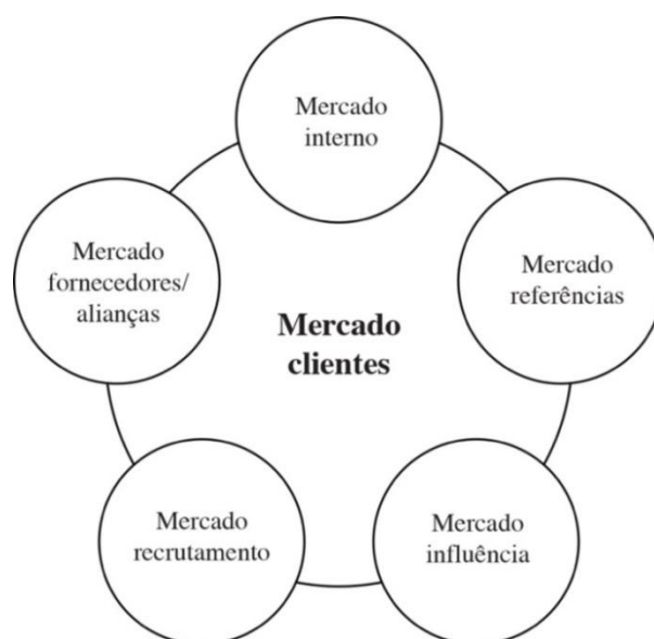
Figura 1. Modelo dos seis mercados

Para uma melhor compreensão deste modelo, analisa-se, seguidamente, cada um dos mercados.