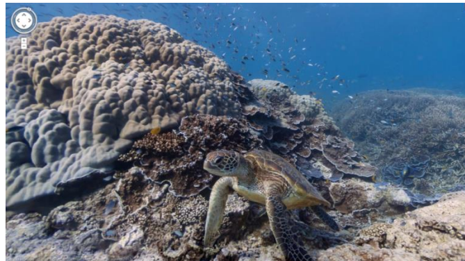
Figura 2 - Imagem da Grande Barreira de Coral na Austrália, obtida da navegação através da plataforma Google Street View