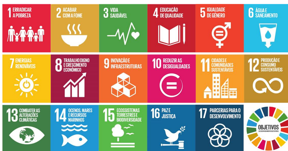
Figura 1 – Objetivos do Desenvolvimento Sustentável (ODS) da UN